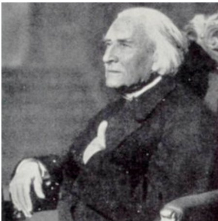
L'Abbé Liszt (1811-1886)

Franz Liszt, tras una etapa muy prolífica en Weimar, se trasladó a Roma en 1861, lugar en el que llevaría una vida algo más retirada. Tal vez el dolor producido por la muerte en 1859 de su hijo Daniel, añadido a la muerte de su hija Blandine en 1862, le hicieron refugiarse en un ambiente más íntimo y solitario, llegando a recibir las órdenes menores: ostiario, lector, exorcista y acólito, y pasando a ser llamado en ocasiones abbé Liszt .