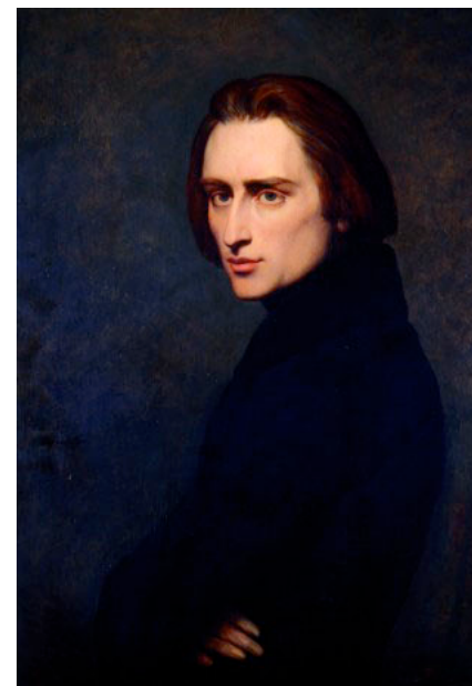
Franz Liszt (1811-1886)

M.I. Ayuntamiento San Lorenzo de El Escorial Concejalía de Cultura