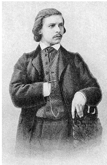
Carl Tausig (1841-1871)

La continuación de la temporada 2013-2014 que hoy retomamos es, en realidad, una nueva temporada en toda regla. Si hasta ahora nos hemos centrado principalmente en conmemorar el bicentenario del nacimiento de Richard Wagner, una vez pasada la efeméride modificamos el hilo conductor de nuestros actos musicales. Así, en los meses que vienen nos centraremos en la presentación de la integral de los Poemas Sinfónicos de Liszt, que en total suman trece, a los que se añaden dos episodios del Fausto de Lenau y un epílogo sinfónico al Poema sinfónico n° 2, ( Tasso, lamento e trionfo ) titulado Le triomphe funèbre du Tasse .